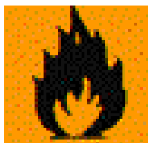
Produkt wysoce łatwo palny