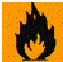
Produkt wysoce łatwo palny